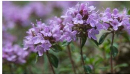
Сибирский чабрец Thymus serpyllum