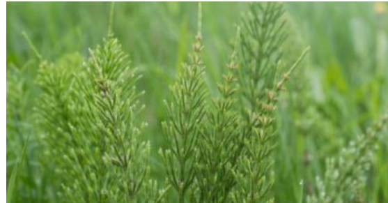
Хвощ Equisetum arvense