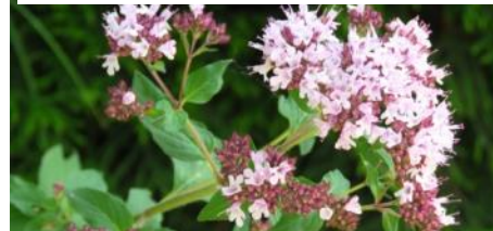
Душица сибирская Origanum vulgare