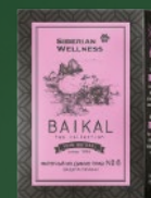
500586 Фиточай из диких трав № 6 (ЗАЩИТА ПЕЧЕНИ)