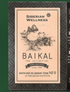
5005849 Фиточай из диких трав № 9 (УГЛЕВОДНЫЙ КОНТРОЛЬ)