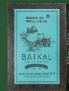
500583 Фиточай из диких трав № 3 (ПРИРОДНЫЙ АНТИСТРЕСС)