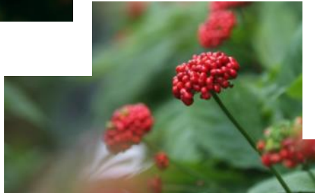
Сибирский женьшень Eleutherococcus senticosus