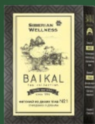
500581 Фиточай из диких трав № 1 (ОЧИЩЕНИЕ И ДРЕНАЖ)

Наши фиточаи обладают цельным, сбалансированным вкусом и ароматом. Все травы, которые мы используем в своих рецептурах, разрешены к пищевому употреблению и входят в список безопасных ингредиентов российской фармакопеи.