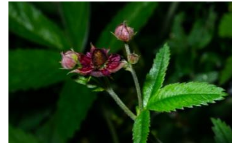
Сабельник Comarum palustre