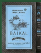
500584 Фиточай из диких трав № 4 (ЛЕГКОЕ ДЫХАНИЕ)