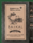
500588 Фиточай из диких трав № 8 (СЕРДЕЧНЫЙ КОМФОРТ)