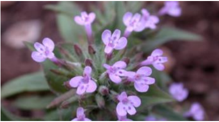
Зизифора Ziziphora bungeana