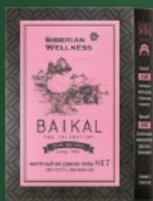
500587 Фиточай из диких трав № 7 (ЛЕГКОСТЬ ДВИЖЕНИЙ)