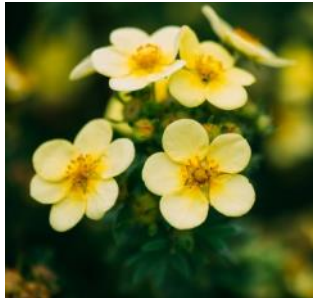
Курильский чай Pentaphylloides fruticosa