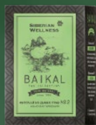
500582 Фиточай из диких трав № 2 (ЖЕНСКАЯ ГАРМОНИЯ)