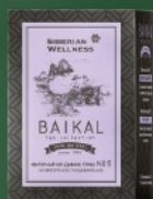
500585 Фиточай из диких трав № 5 (КОМФОРТНОЕ ПИЩЕВАРЕНИЕ)